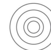
25 mm [1"]